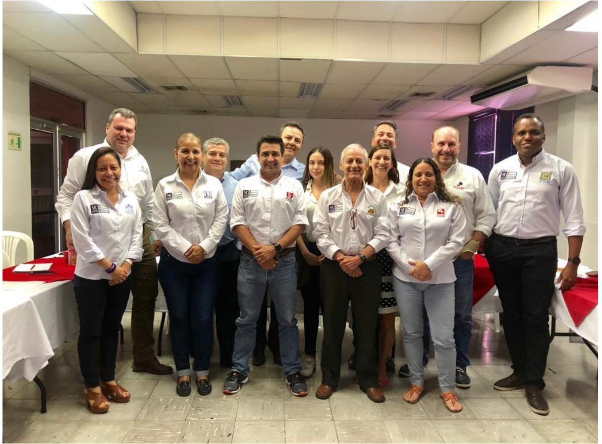
Incluyo a continuación, la foto del 8 de Febrero de 2022 cuando se hizo la plenaria para elegir líderes de mesas y Coordinador del Nodo Cali, Valle, en la Universidad ICESI.